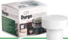
DURGO VENTIL DN 75 Größe: DN 75 Geeignet für 4-6 Bäder Art.-Nr.: 7000.075