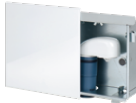
EINBAUKASTEN PREMIUM Inkl. Frontblende weiß (7900.100) und DN 50 Plus Ventil Art.-Nr.: 7900.055