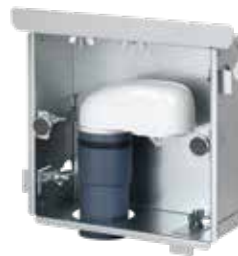
EINBAUKASTEN PREMIUM Ohne Frontblende inkl. DN 50 Plus Ventil Art.-Nr.: 7900.000