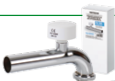
ABGANGSROHR 90° ½ Zoll IG., 32x250 mm Art.-Nr.: 7300.015