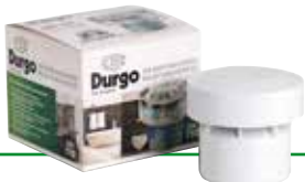
DURGO VENTIL DN 110 Größe: DN 110 Geeignet für 6-12 Bäder Art.-Nr.: 7000.110