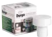
DURGO VENTIL DN 50 Größe: DN 50 Geeignet für max. 4 Bäder Art.-Nr.: 7000.050