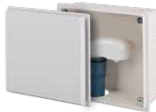
EINBAUKASTEN BASIC Inkl. Frontblende und DN 50 Plus Ventil Art.-Nr.: 7550.000