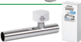
ABGANGSROHR GERADE ½ Zoll IG., 32x250 mm Art.-Nr.: 7310.015