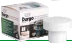
DURGO VENTIL DN 90 Größe: DN 90 Geeignet für 6-12 Bäder Art.-Nr.: 7000.090